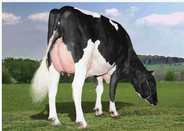
Trisnonna Endco Yoder L7933 9839-ET