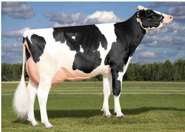
Bisnonna AOT Jared Haskel-ET